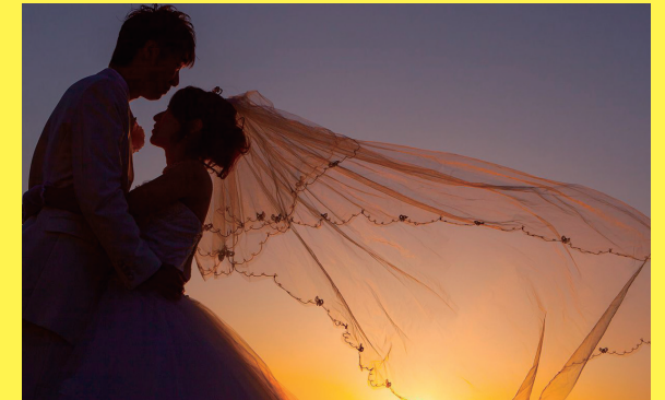
函館穴潤海岸 夕景