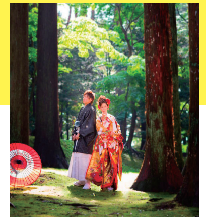
香雪園 木漏れ陽のなかで